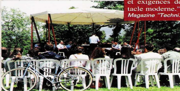
Musique dans le Parc Le Vésinet.

Léger, transportable, il accompagne la vie publique dans ses rassemblements, dans ses fêtes, invitant