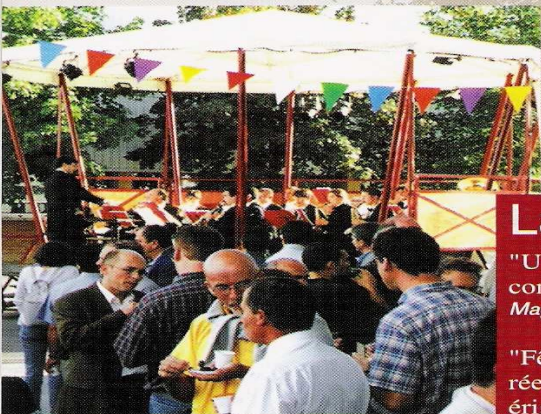
"Coeur de village" avec l'orchestre capitoile 20 ème anniversaire de Matra Espace, à Toulouse.

En intérieur comme à l'extérieur, seul ou associé à d'autres réalités d'exposition, le Kiosque Scénique est un élément focalisateur ou fédérateur d'un événement ou d'un site.