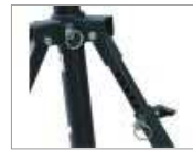
Patte Télescopique à double sécurité pour terrain accidenté