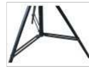
Patte à double traverse pour une stabilité maximale