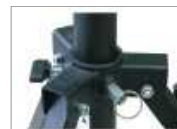
Chariot à double verrouillage pour le réglage de l'empattement