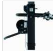
05 Treuil anti retour