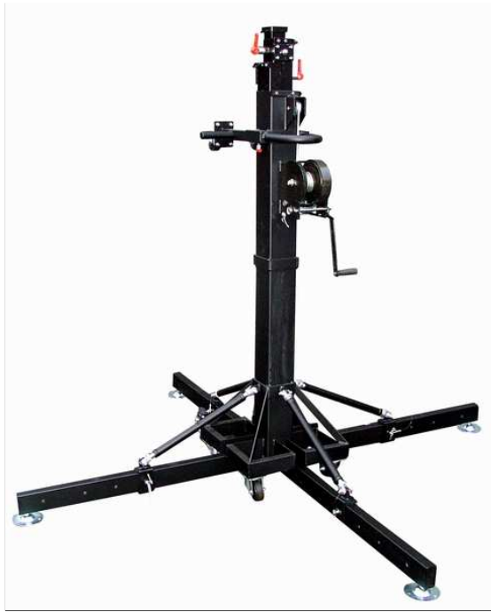
01 Position dépliée